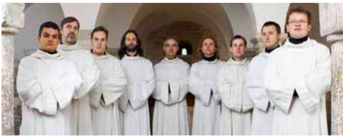
Schola Gregoriana Pragensis