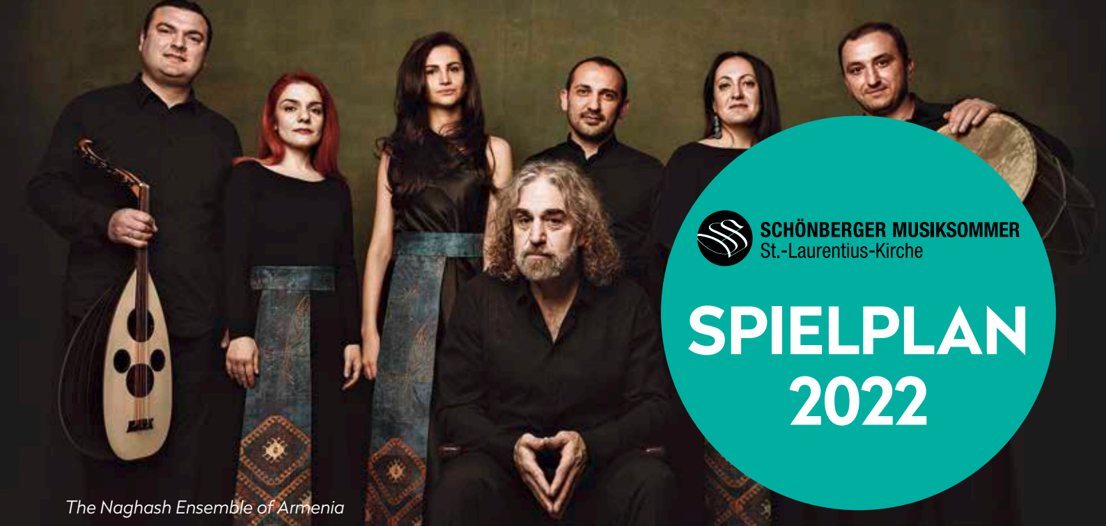
The Naghash Ensemble of Armenia