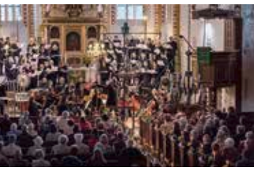
Eröffnung des Schönberger Musiksommers