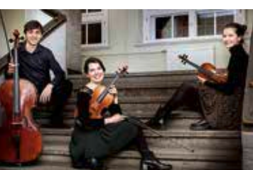
Studierende der Musikhochschule Lübeck