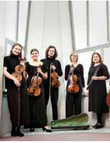
Studierende der Musikhochschule Lübeck