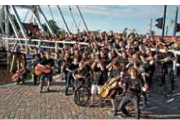
Landesjugendorchester Mecklenburg-Vorpom- mern