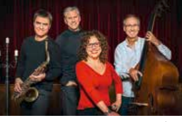
Die Haase mit Jazzebo