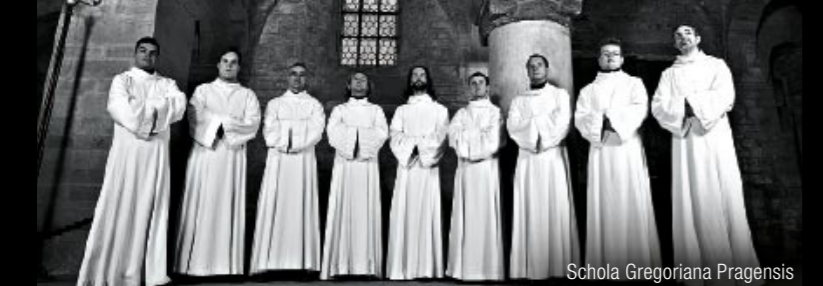
Schola Gregoriana Pragensis