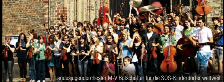
Landesjugendorchester M-V Botschafter für die SOS-Kinderdörfer weltweit