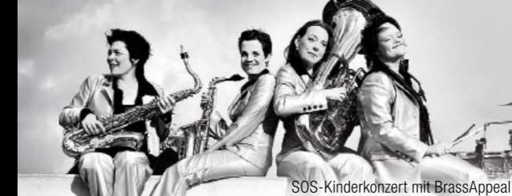
SOS-Kinderkonzert mit BrassAppeal