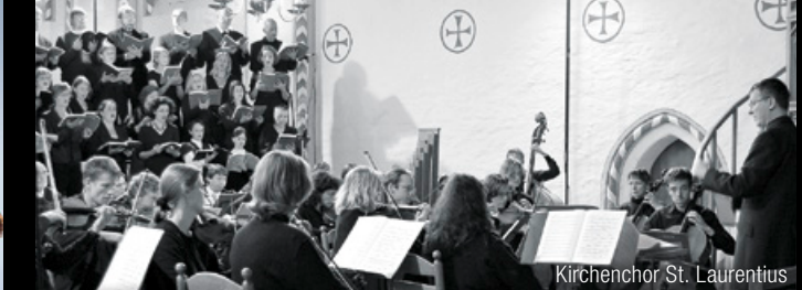
Kirchenchor St. Laurentius