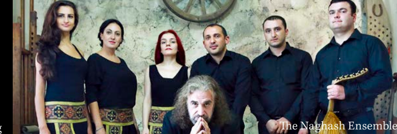
The Naghash Ensemble