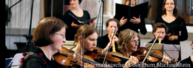
Telemannisches Collegium Michaelstein