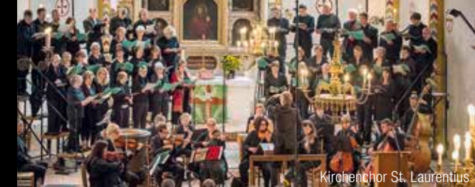
Kirchenchor St. Laurentius