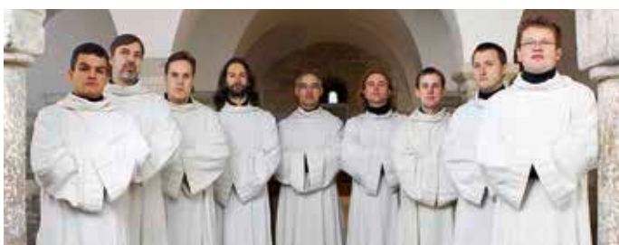
Schola Gregoriana Pragensis