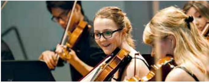
Kammerorchester der Musikhochschule Lübeck

DI 22.06.2021 / 20:00 UHR / EINTRITT 15.- €