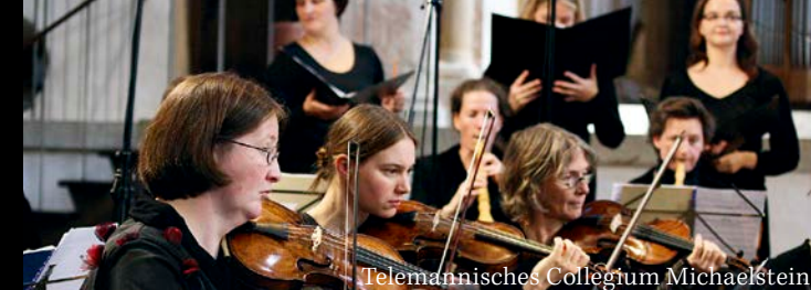
Telemannisches Collegium Michaelstein