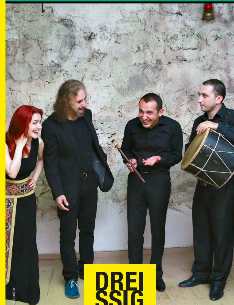
The Highash Ensemble