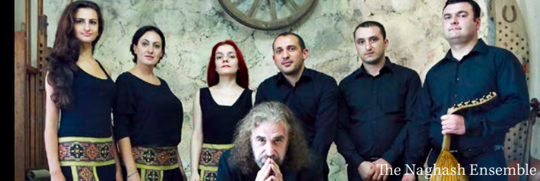
The Naghash Ensemble