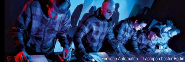
Endliche Automaten – Laptoporchester Berlin